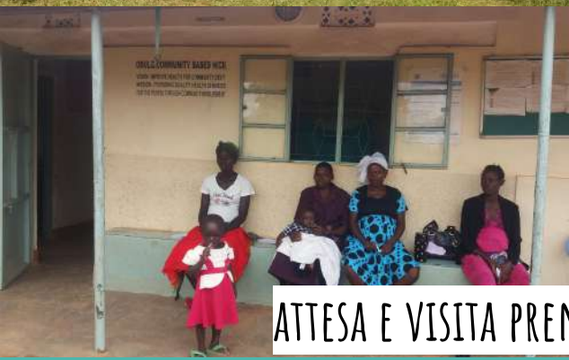
ATTESA E VISITA PRENATALE IN CORSO