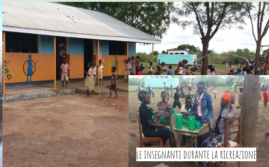
LE INSEGNANTI DURANTE LA RICREAZIONE