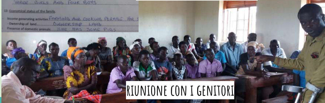
RIUNIONE CON I GENITORI